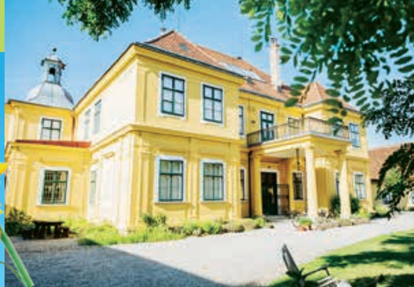
Familiendomizil Sogar das große Gutshaus strahlt in der Farbe des Sommers